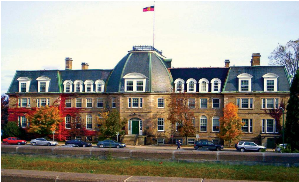
Universiteit van New Brunswick, Fredericton.